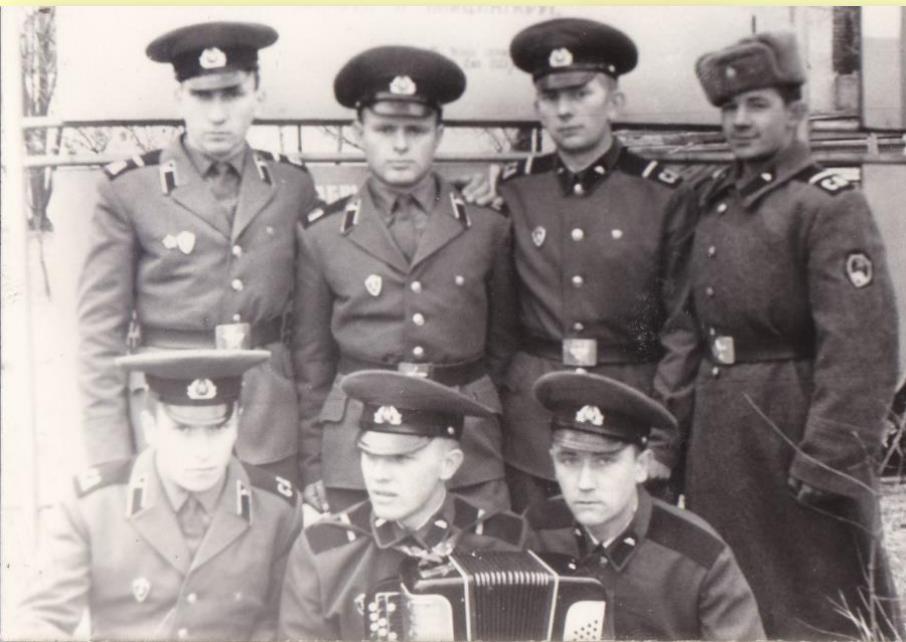
Боевые товарищи моего дедушки