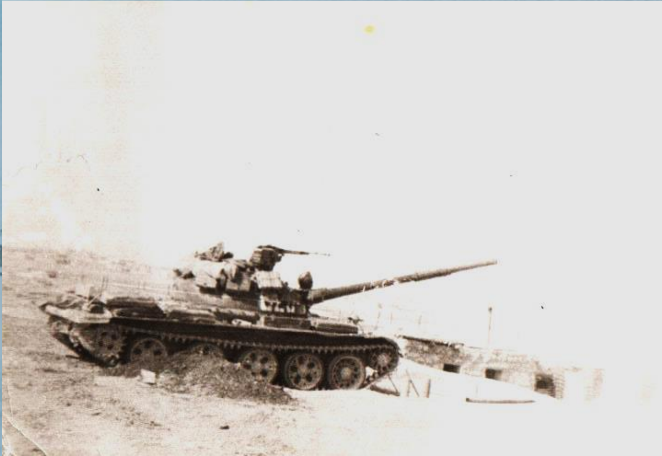
Танк, на котором воевал мой дедушка