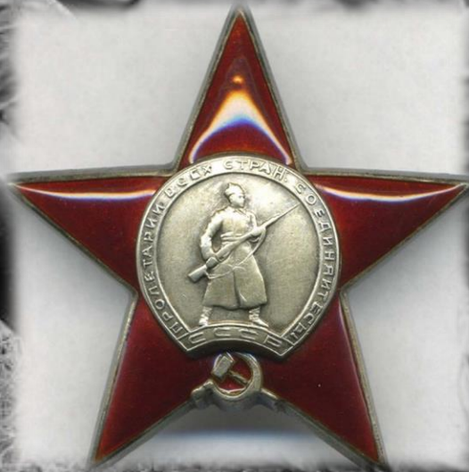
Орден «Красной Звезды»

Мой дедушка под огнем вынес четверых раненых бойцов с поля боя, за что был награжден медалью «За Отвагу». Он одним танком отразил атаку врага на колонну из нескольких десятков машин, за что был награжден орденом «Красной звезды».