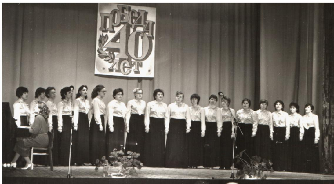
Хор учителей Обуховской школы