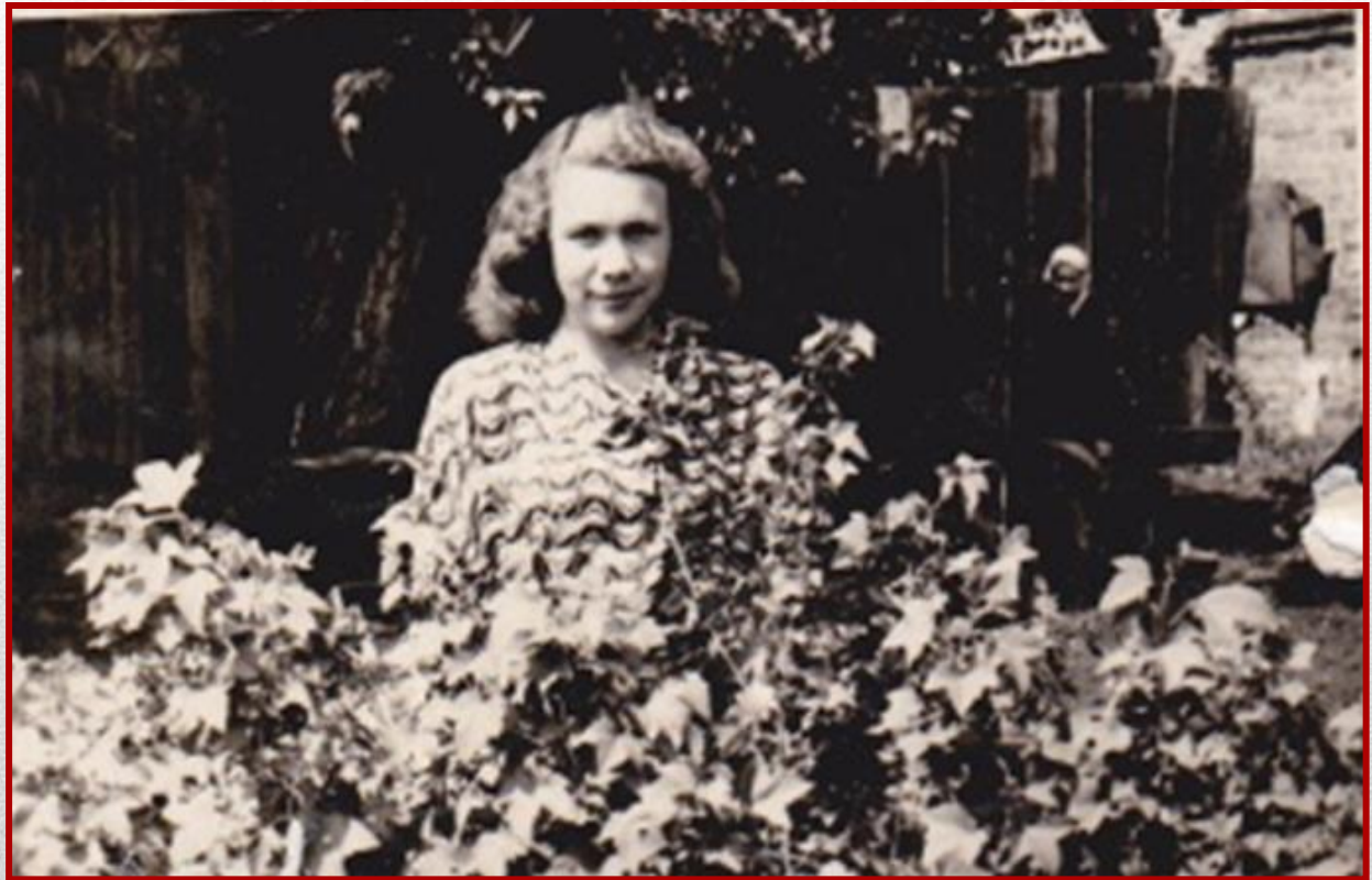
Перед выпускным из Педагогического училища