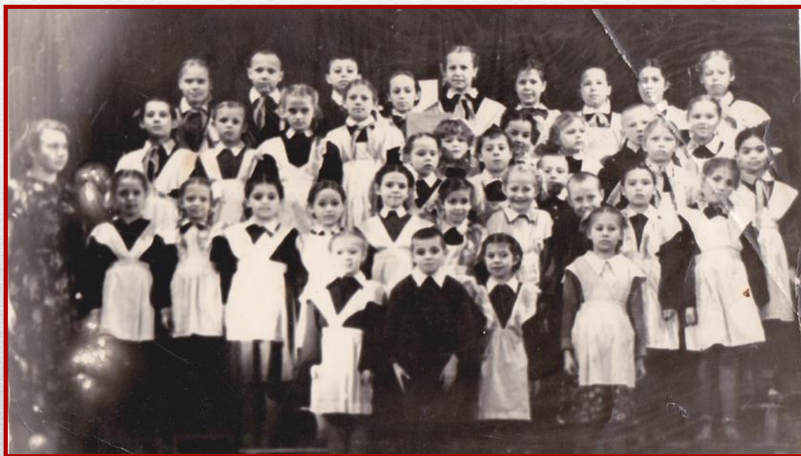
Детский школьный хор из деревни Сосновка

После окончания училища, Ира начинает работать учителем в деревне Сосновка, организует хор, который часто выступает на районных и школьных смотрах.