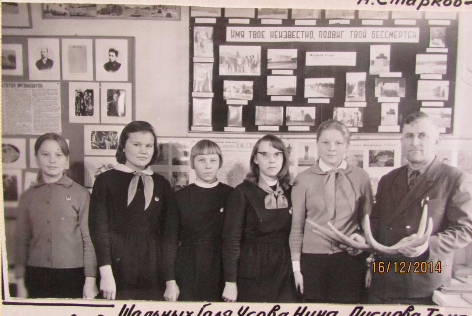
Юные краеведы, январь 1965г.

кой социалистической революции. А. Старков