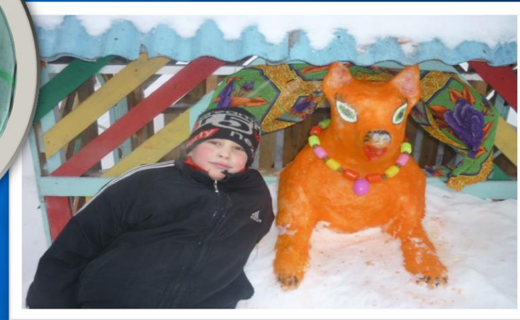
Вот какие творческие люди живут в российских глубинках...