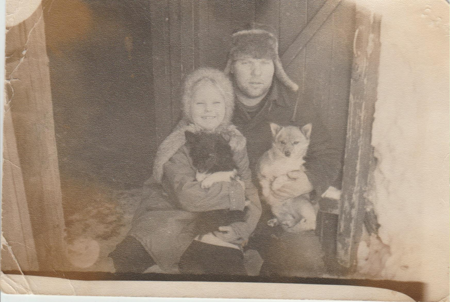
С папой, Травкой и Куклой. 1972 г.

Она родилась 7 декабря 1965 года в Пермском крае в рабочем посёлке Сарс. Детство было очень весёлое и счастливое. Любила животных, особенно кошек и собак: «Со слезами уговаривала родителей приютить брошенных щенков или котят».