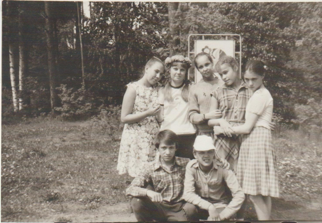
Вожатая в пионерском лагере. 1985 г.