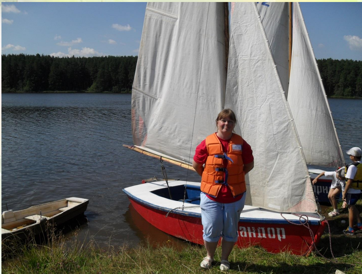
«Оранжевое лето». 2010 г.