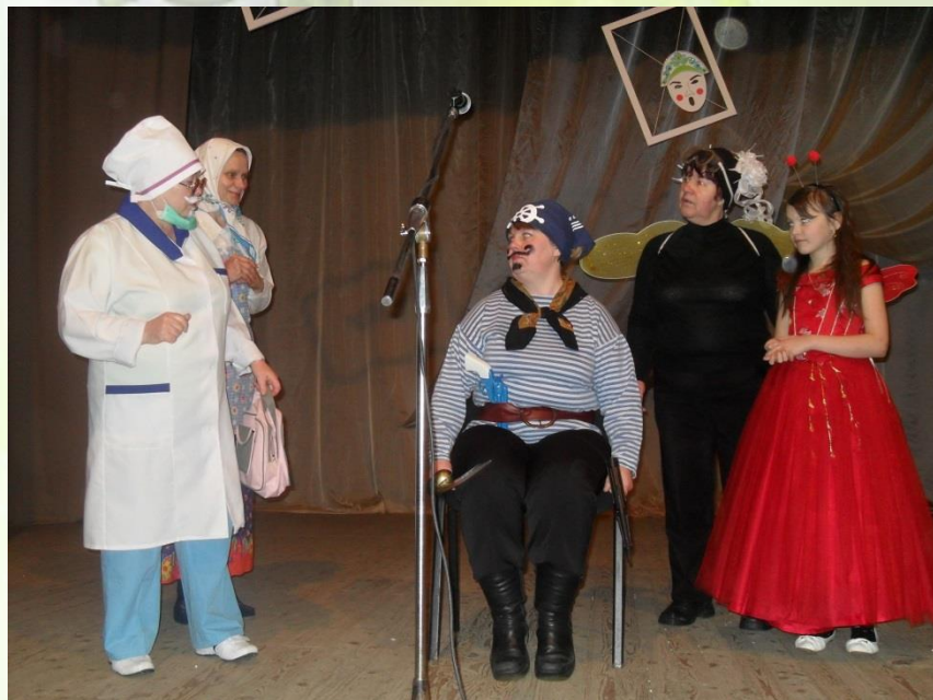
Литературный праздник, посвящённый юбилею К.И.Чуковского. 2014 г.