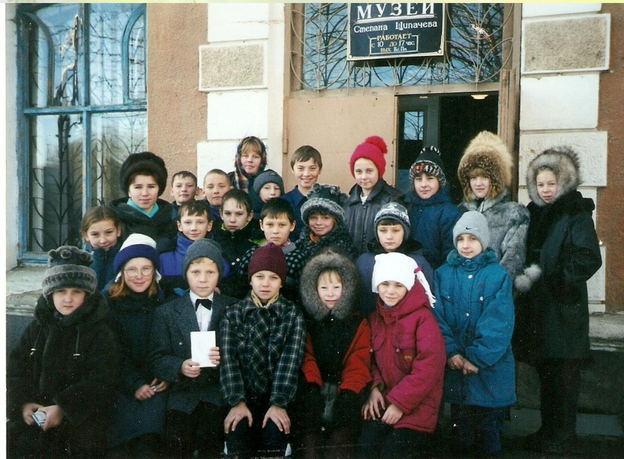
В литературном музее С.П.Щипачёва. г. Богданович. 2000 г.