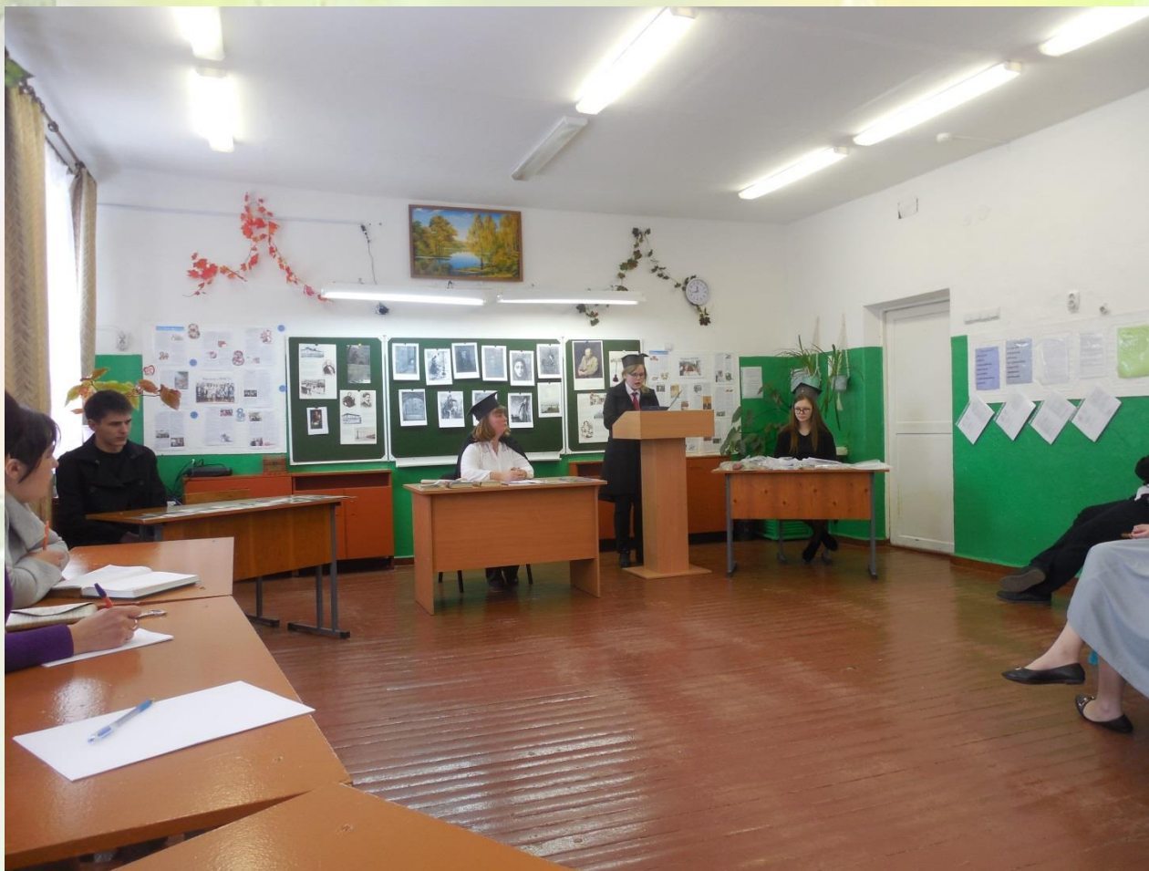
Урок литературы. Суд над Раскольниковым. 2016 г.