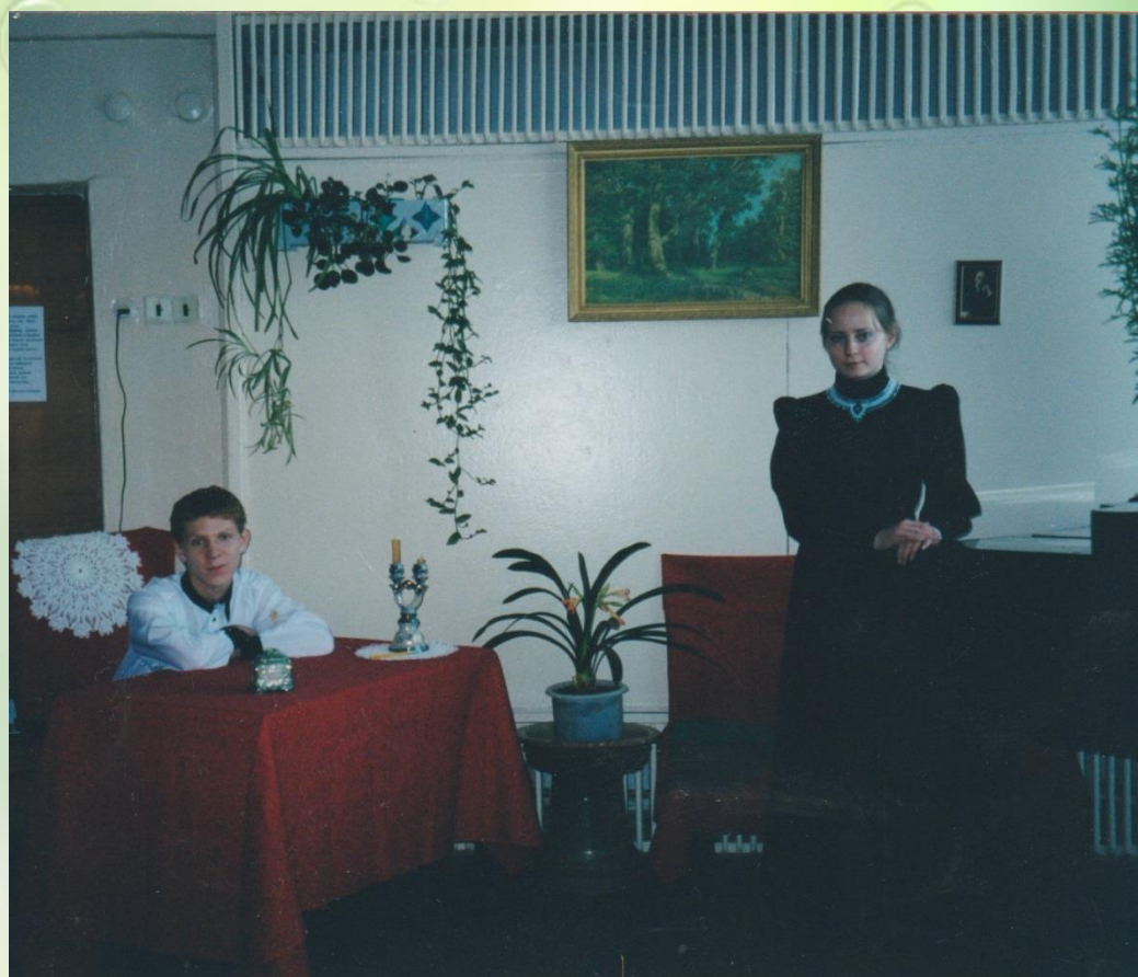
Сцена из литературной гостиной «Я вас любил...», посвящённой Д.Н.Мамину – Сибиряку. 2005 г.