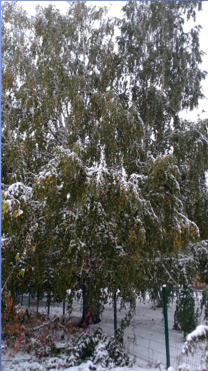
«Первый снег» 27 сентября 2022 г