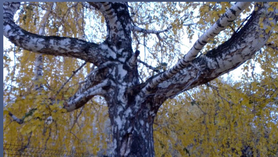
«Береза- великан» 12 октября 2022 г.

Ветки березы не раз были сломаны, но не смотря ни на что, она продолжает расти.