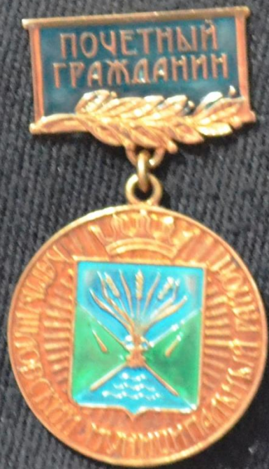
Почётный гражданин Камышловского района