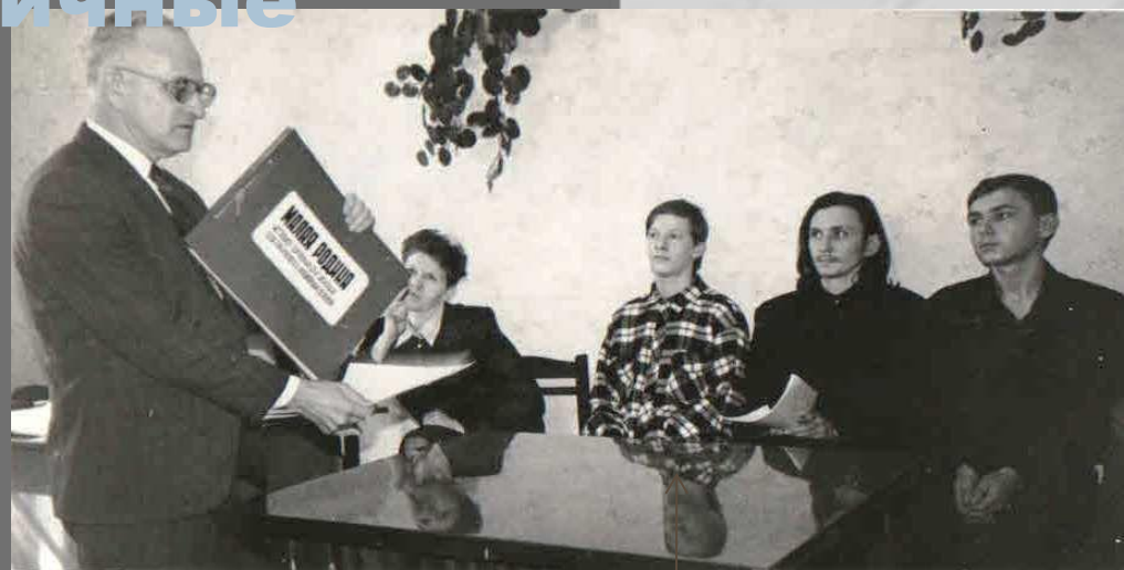
Активный участник краеведческой конференции 2000г.