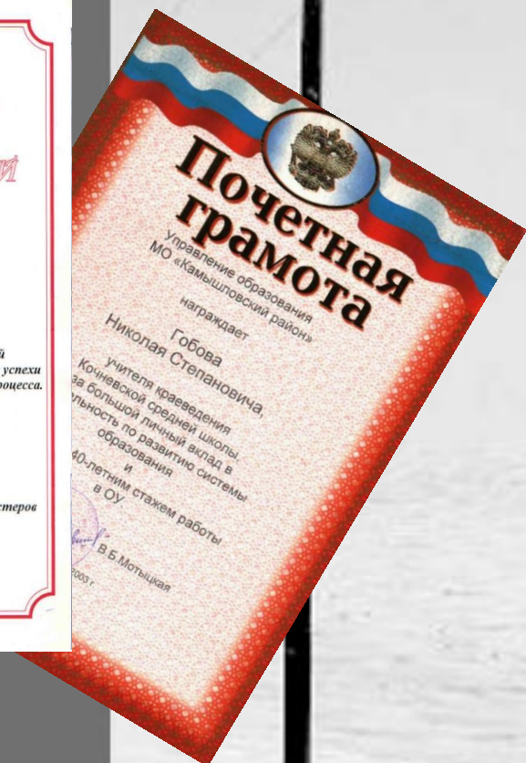
Заслуженный учитель РФ