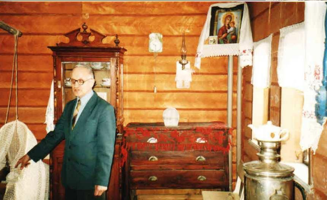
Экскурсия в школьном краеведческом музее. Возле люльки в которой качали дедушку