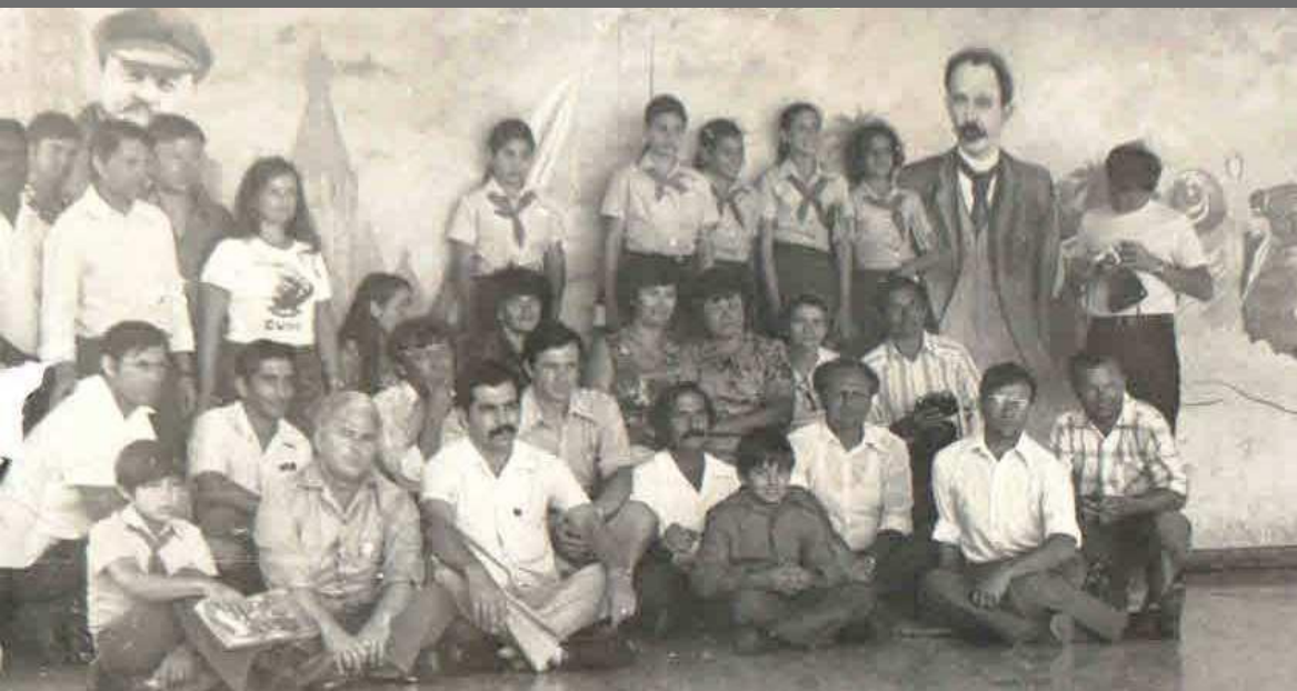
Среди учащихся и учителей школы имени Гагарина г. Гавана Куба 1978г.