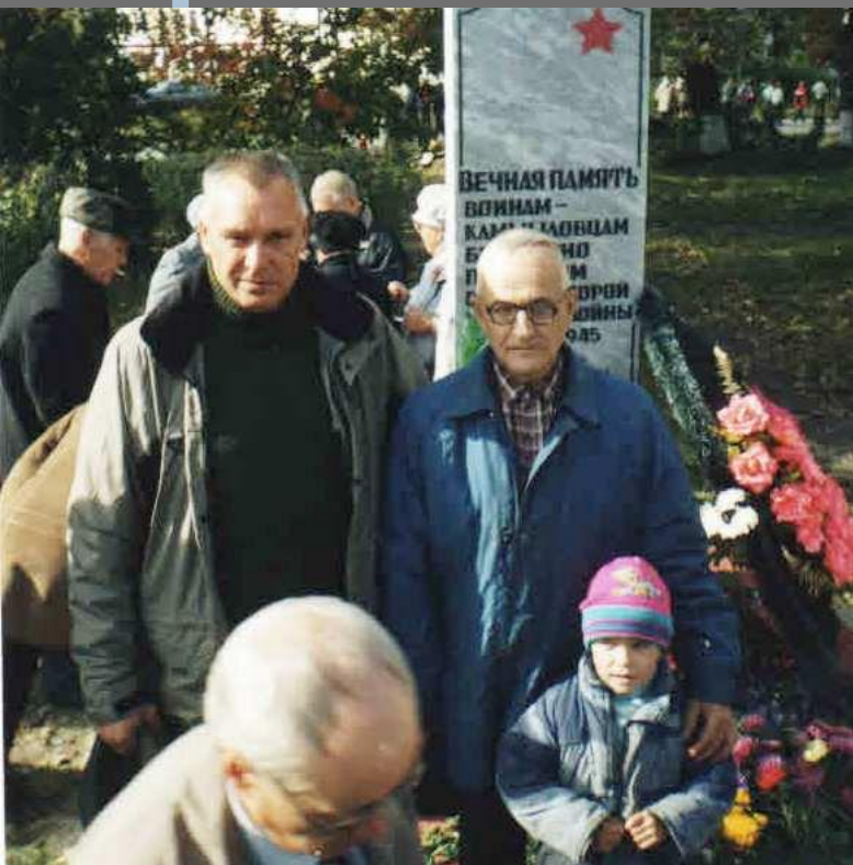
На открытии памятника безвестному солдату в г. Камышлове