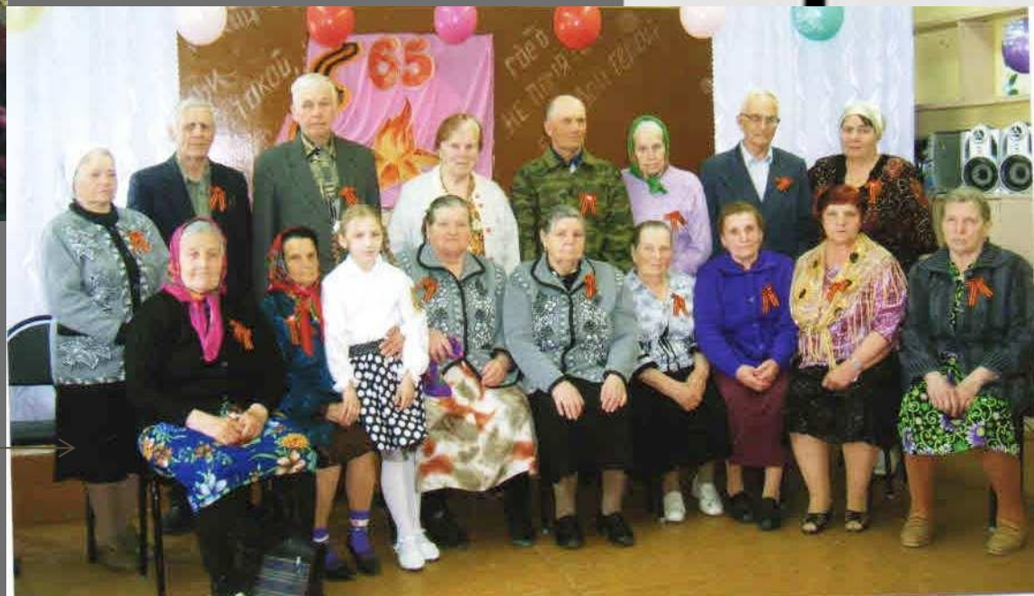
Встреча с детьми погибших в Вов 2010г.