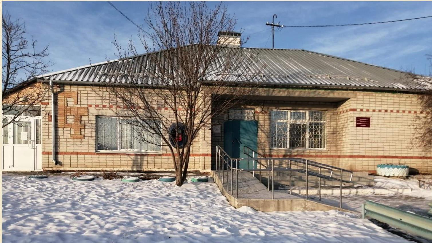
Обуховский фельдшерско-акушерский пункт

Проблемы сельскому Совету приходилось решать разные: водоснабжение, канализация, строительство фельдшерско-акушерского пункта, реализация земельной реформы.