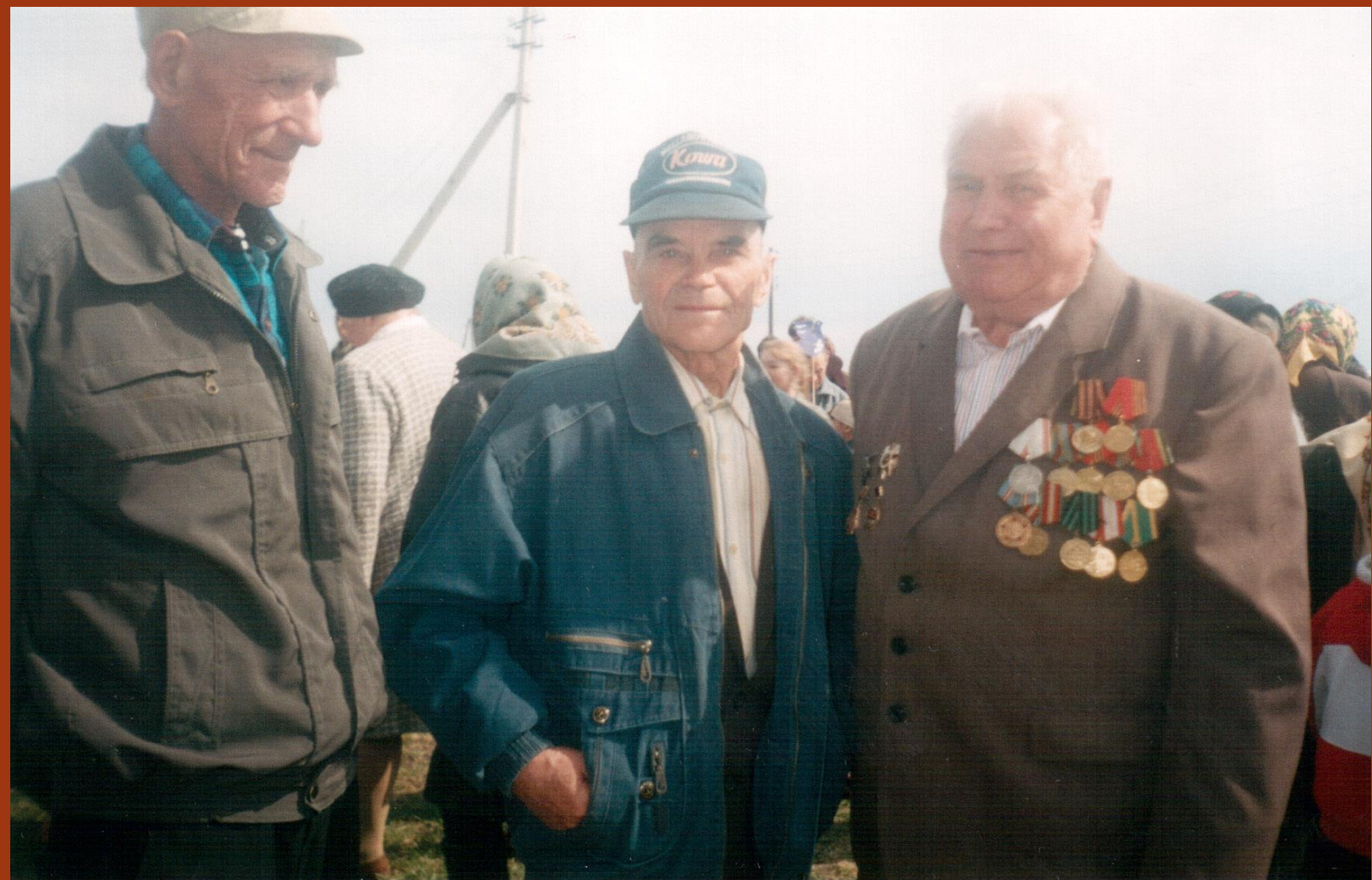
Весна 2004 года