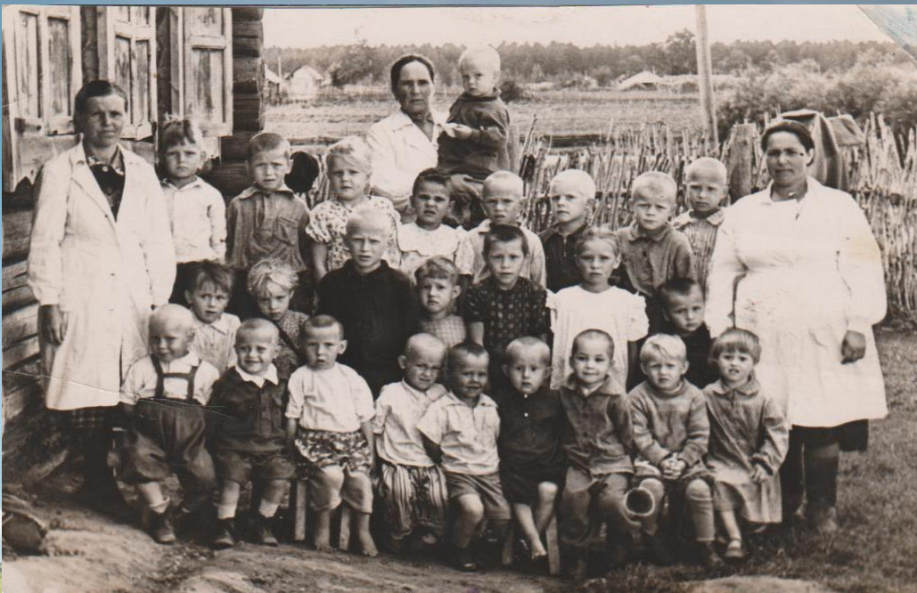
Коровяковский детский сад