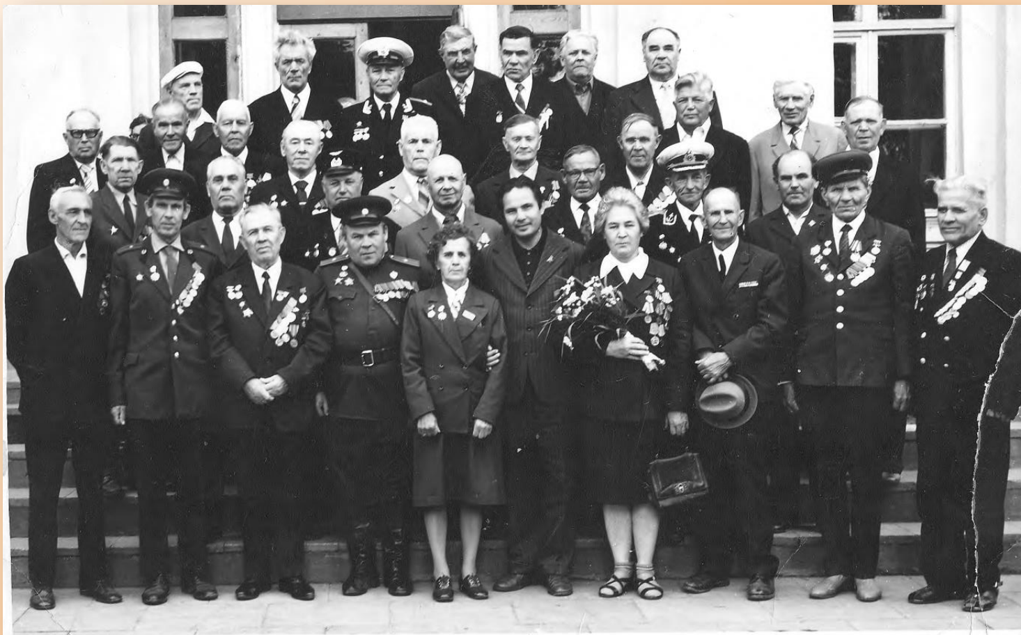
(на фотографии во втором ряду первый слева)

Свой организаторский талант Степан Сергеевич проявил и в мирной деятельности после войны: работал председателем ДОСАРМ, директором кинотеатра «Октябрь», был завхозом на хлебозаводе. На встречах с молодым поколением рассказывал о подвигах и смелости русских солдат. В канун Дня Победы встречался с ветеранами Великой Отечественной войны.