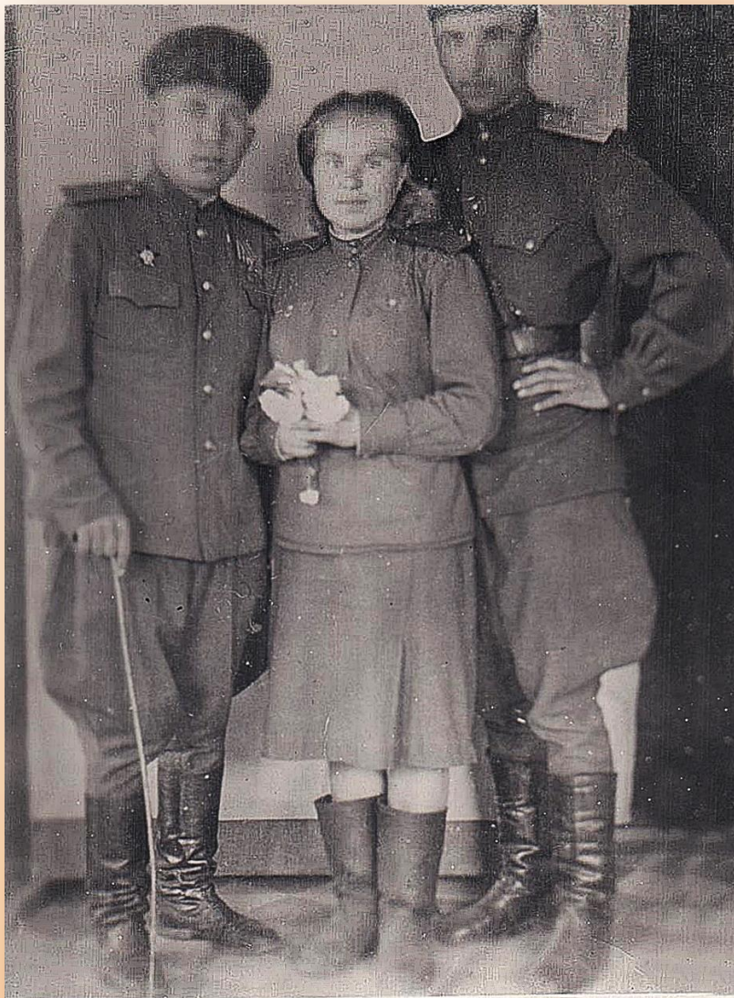
(слева на фотографии)