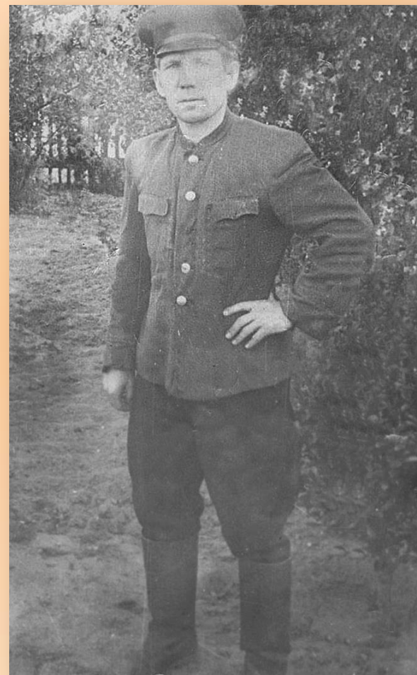
1945 г. город Варшава